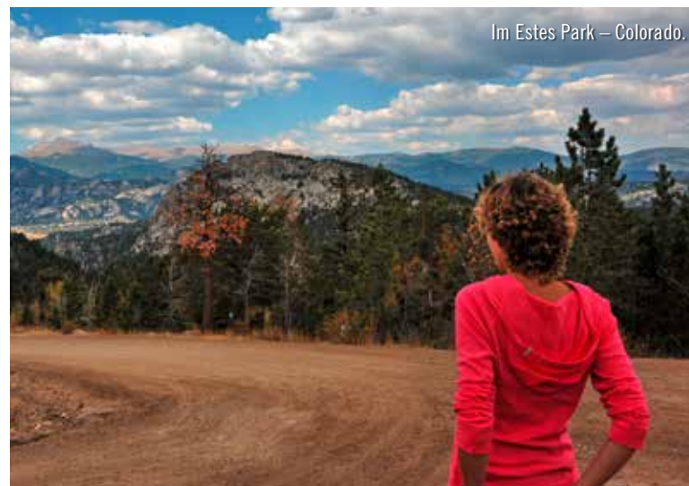
Im Estes Park – Colorado.

Sie wollte dankbar sein und mit Gott leben. Das war ein Entscheid, den sie gefällt hatte und immer wieder fällen musste. Es war für sie immer eine riesen Freude, wenn es aufwärtsging. Aber sie haderte nicht mit Gott, wenn es anders war, sondern sagte: «Jesus, ich weiss, du meinst es trotzdem gut.»