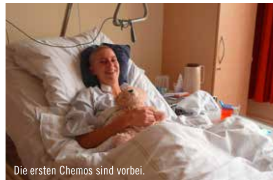
Die ersten Chemos sind vorbei.