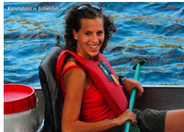
Kanufahren in Schweden.