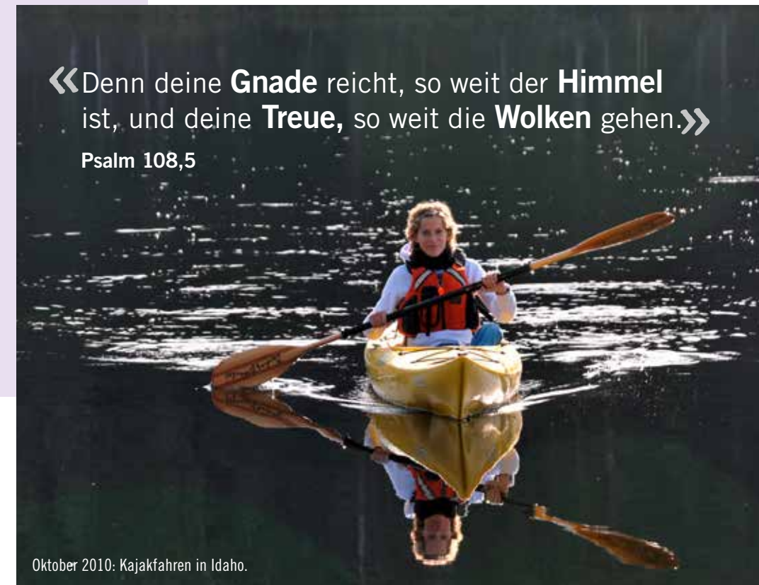
Oktober 2010: Kajakfahren in Idaho.

Chancen dafür, dass wir Ihn nicht loslassen. Wenn es einen Zusammenhang geben würde zwischen der Menge oder der Intensität der Gebete um Heilung und der Heilung selbst, dann müsste Lydia längst gesund sein. Möglicherweise würde dann heute niemand mehr darüber reden, bzw. auch niemand Ermutigung für seinen Glauben erfahren. Natürlich wissen wir das alles nicht. Aber wir können es Gott hinlegen und sagen: «Herr, wir vertrauen dir, mach du was daraus.»