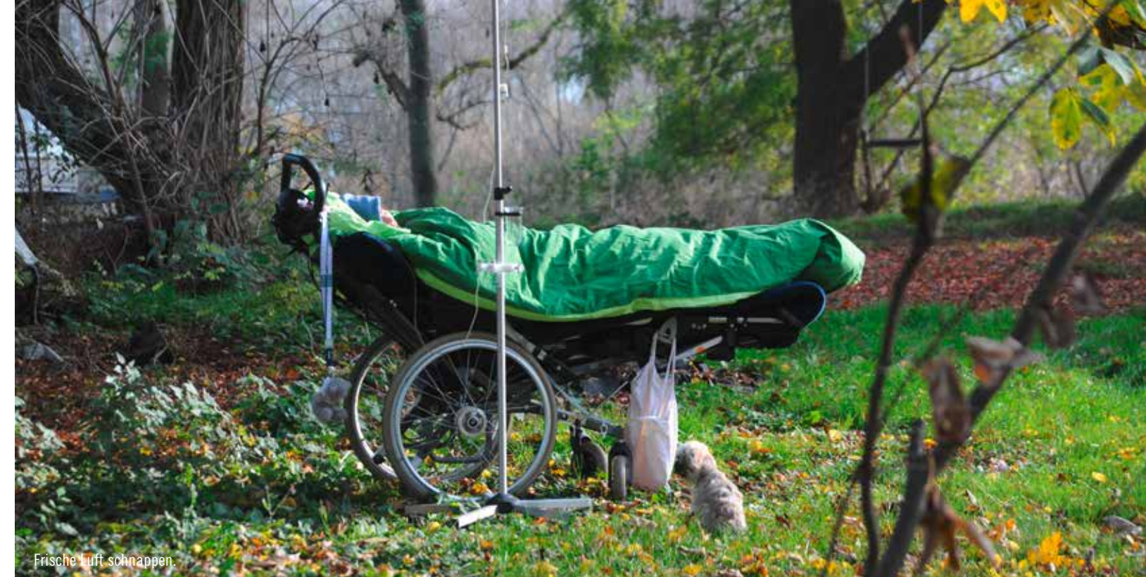
Frische Luft schnappen.